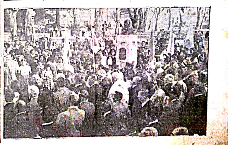
BUSTO. Aspecto de la ceremonia en memoria cumplida ayer en ocasión de inaugurarse el busto de Leonardo Da Vinci, erigido por la colectividad italiana.

trataban de reanudar manifestaciones. Los motines comenzaron cuando a raíz de un procedimiento de la policía, dos nativos atacaron armados de cuchillos, palos y picos. Los agentes se replugaron brevemente y echando cuerpo a tierra hicieron fuego de revólver, fusiles, ametralladoras y pistolas contra los manifestantes. La situación se hizo confusa cuando grupos de manifestantes atacaron y agredieron un club. des oficiales por el gobierno provincial interrumpió su permanencia. El jueves próximo los viajeros se trasladarán por la mañana a la ciudad de San Juan, volviendo esa misma noche a Mendoza, donde permanecerán hasta el domingo 16, fecha en que emprenderán el regreso a esta capital para reanudar sus actividades al día siguiente.